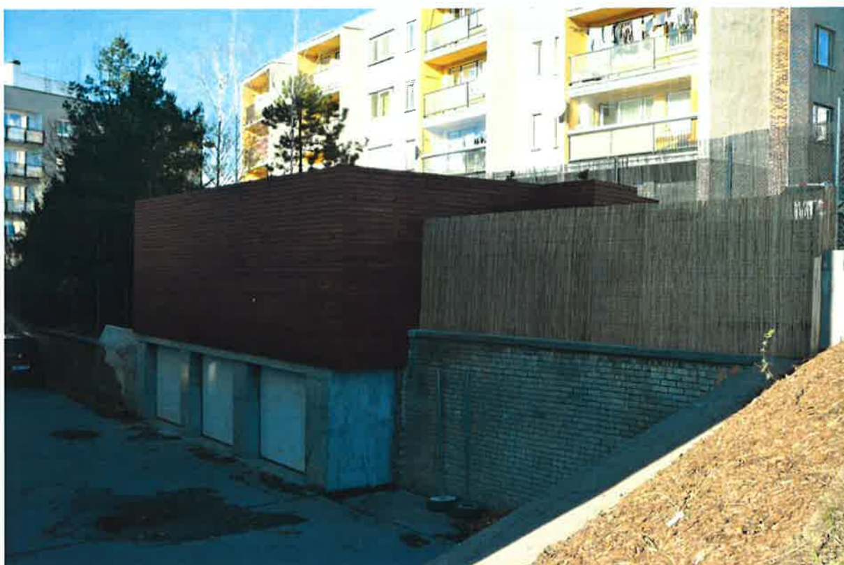
Snímek pořízen 14.11.2010.