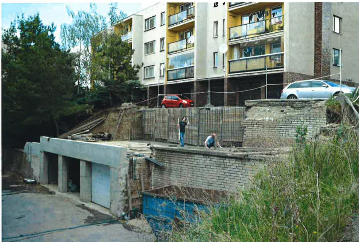
Snímek pořízen 18.9.2010.